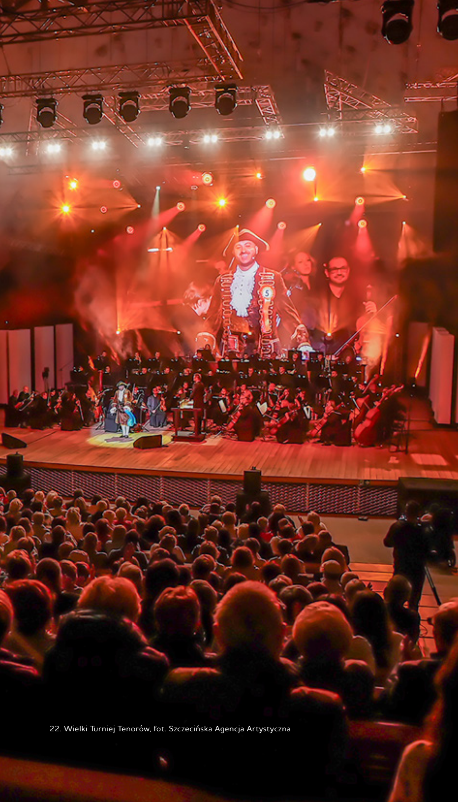
22. Wielki Turniej Tenorów